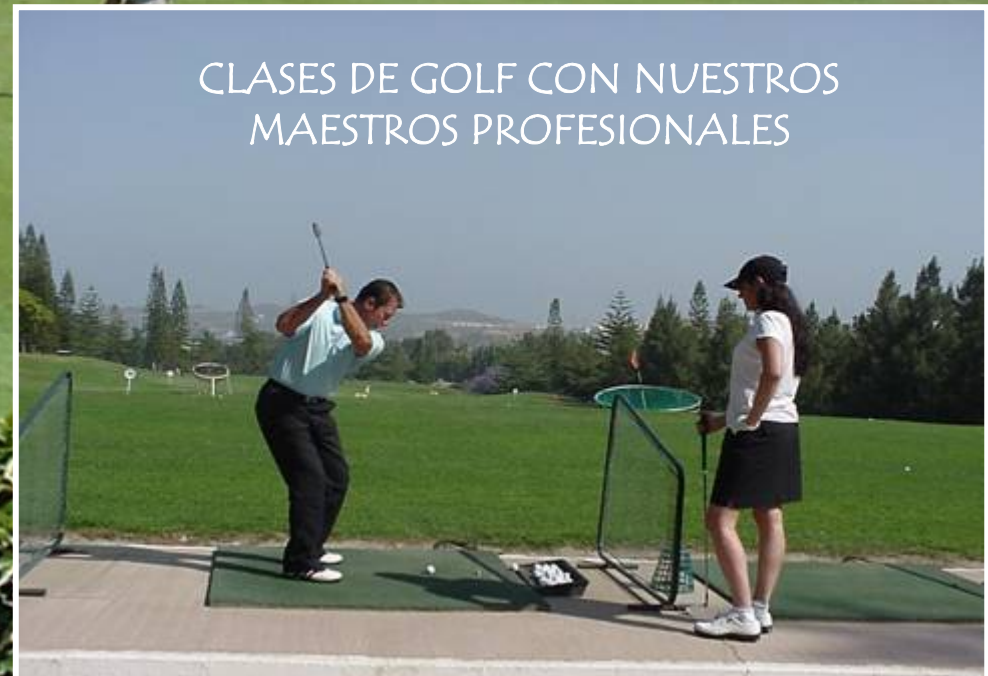
CLASES DE GOLF CON NUESTROS MAESTROS PROFESIONALES