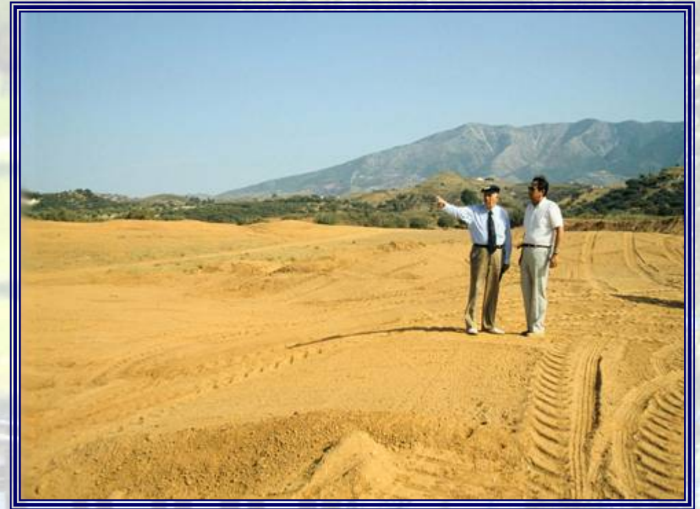
Robert Trent Jones dando instrucciones al greenkeeper durante la construcción de "Los Olivos" en 1983

El juego capturó la imaginación de Jones, y durante su adolescencia fue caddy para Hagen en diversas exhibiciones, de esta manera empezó a emerger como un jugador experto. A los 21 años, y como jugador amateur consiguió la décima posición en el Open de Canadá, pero su carrera como jugador se vio truncada por una úlcera. Jones estudió el trabajo que el legendario arquitecto Donald Ross realizó en los 36 hoyos del campo Oak Hill Country Club, éste estudio le inspiró en la idea acerca del arte de diseñar campos. Jones se asoció con el arquitecto canadiense Stanley Thompson desde 1932-40, e incluso en la época post-depresión, juntos construyeron imborrables clásicos como el campo "Capilano" en Vancouver y "Branff" en las Rocosas Canadienses. En 1948 Jones colaboró con otros personajes de renombre del mundo del golf como Bobby Jones, Robert Tyre Jones Jr., ambos respetados amateurs americanos, en el "Peachtree Golf Club" cerca de Atlanta. En el extenso currículum de Jones también hace gala la construcción de los hoyos nº 11 y nº 16 de "Augusta Nacional", dos de los mejores hoyos en el golf. Jones acuñó el concepto de "Golf Heroico" al proponer que si un jugador quiere abordar un difícil golpe, deberá enfrentarse a un riesgo-recompensado. A partir de esta idea Jones se convertiría en el primer arquitecto que usara el agua como máximo obstáculo.