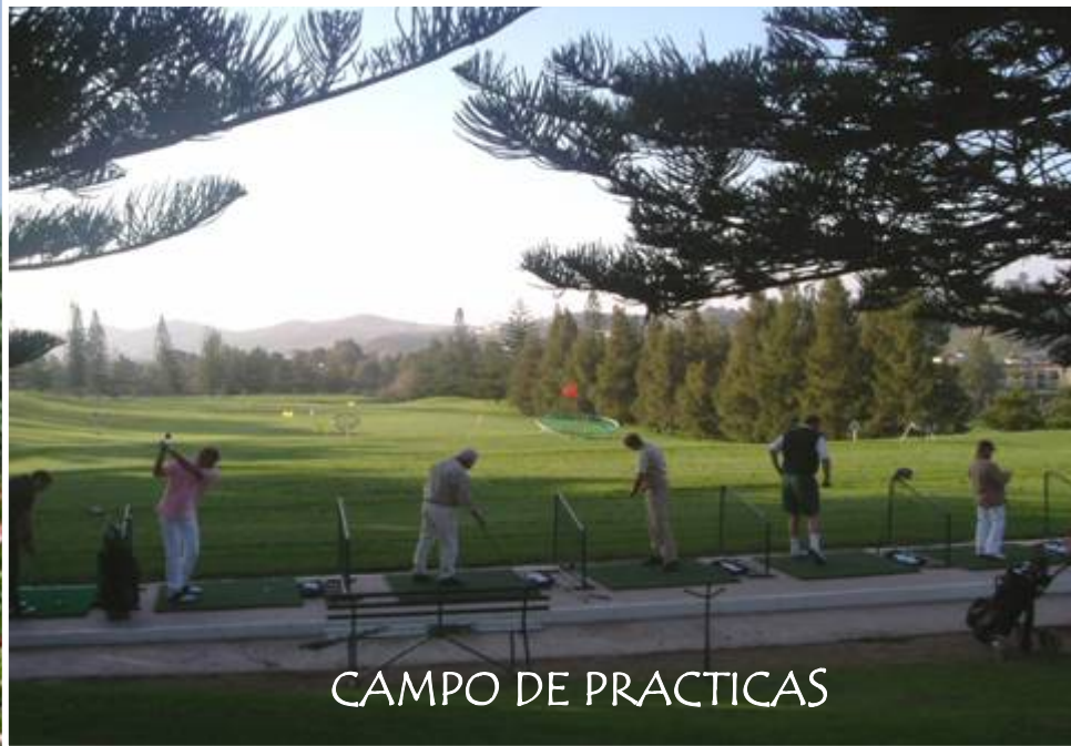
CAMPO DE PRACTICAS