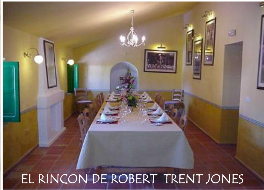
EL RINCON DE ROBERT TRENT JONES